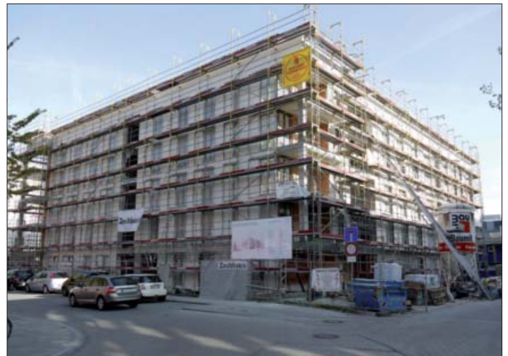
Der Neubau in der Parkstadt Schwabing ermöglicht 46 Familien attraktives und bezahlbares Wohnen in München

mensmiete von 6,50 Euro deutlich unterhalb des Durchschnitts (ausgenommen Fürstenried mit